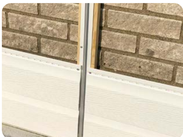
H-profil, inre del monterad