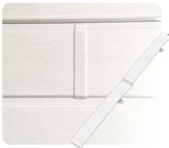
Skarvhylorna ger fina skarvar

Precis som vid annan montering av paneler ska monteringen ske så att det finns möjlighet för panelerna att röra sig. Trä på skarvhylsan nästan helt och lämna ca 2mm från ändläget. Skjut in nästa panel in i skarvhylsan och lämna ca 2 mm från ändläget så att det finns ca 4 mm totalt mellan panelerna bakom hylsan.